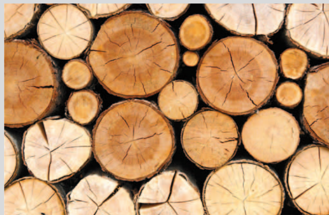
Weitere Infos finden Sie hier: www.kronotex.com You'll find additional information here: www.kronotex.com

We understand that all of our world's ecosystems are sensitive closed systems. In order to prevent these natural processes from spinning out of control, it is essential to avoid interfering with them – for instance, by tampering with the CO 2 cycle. To make sure that our blue planet will continue to be a place worth loving and living on, we are committed to sustainable production and the use of certified raw materials.